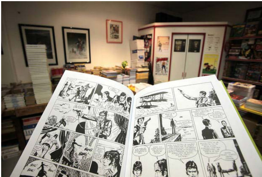
Ko strip sreča film

Kot je znano, sta sedma umetnost filma in deveta, stripovska, v nabor oblik umetniškega izraza vstopili istočasno, leta 1895. Skoraj 120 let zatem sta se prvič obširneje srečali tudi v slovenskem filmu. V dokumentarcu Ko črte govorijo režiserja Jureta Brecejnika in scenarista Žiga Valetiča, v produkciji RTVS in Filma IT.