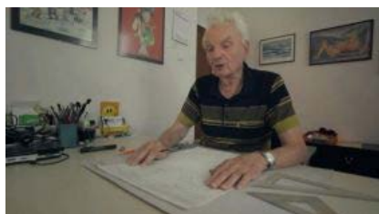
Ob Zvitorepcu, Trdonji in Lakotniku, večnih junakih Mikija Mustra, je odraščalo več generacij ljubiteljev stripa.