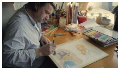
V svetu je prvi strip - zgodbica, prikazana z zaporedjem sličic in z besedilom v oblakih- izšel leta 1895, pri nas 32 let pozneje.