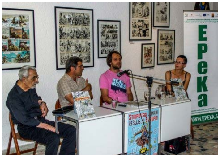
Stripi rešujejo Evropo.