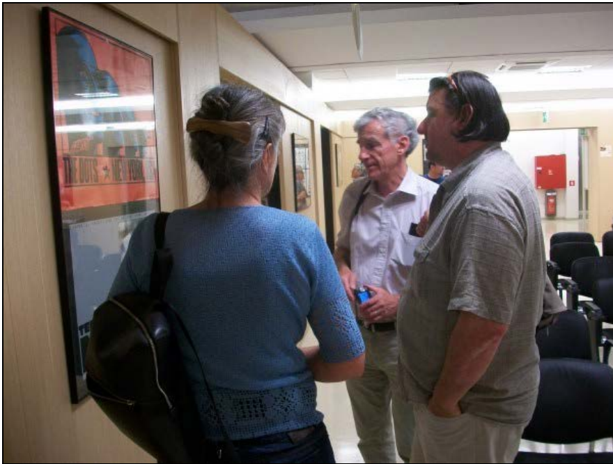
Slika z otvoritve razstave

Predstavitve | Kje smo | Kontakt | Delovni čas | Novo-stripi | Novo-ostalo | Povpraševanje | Drobtinice | Galerija